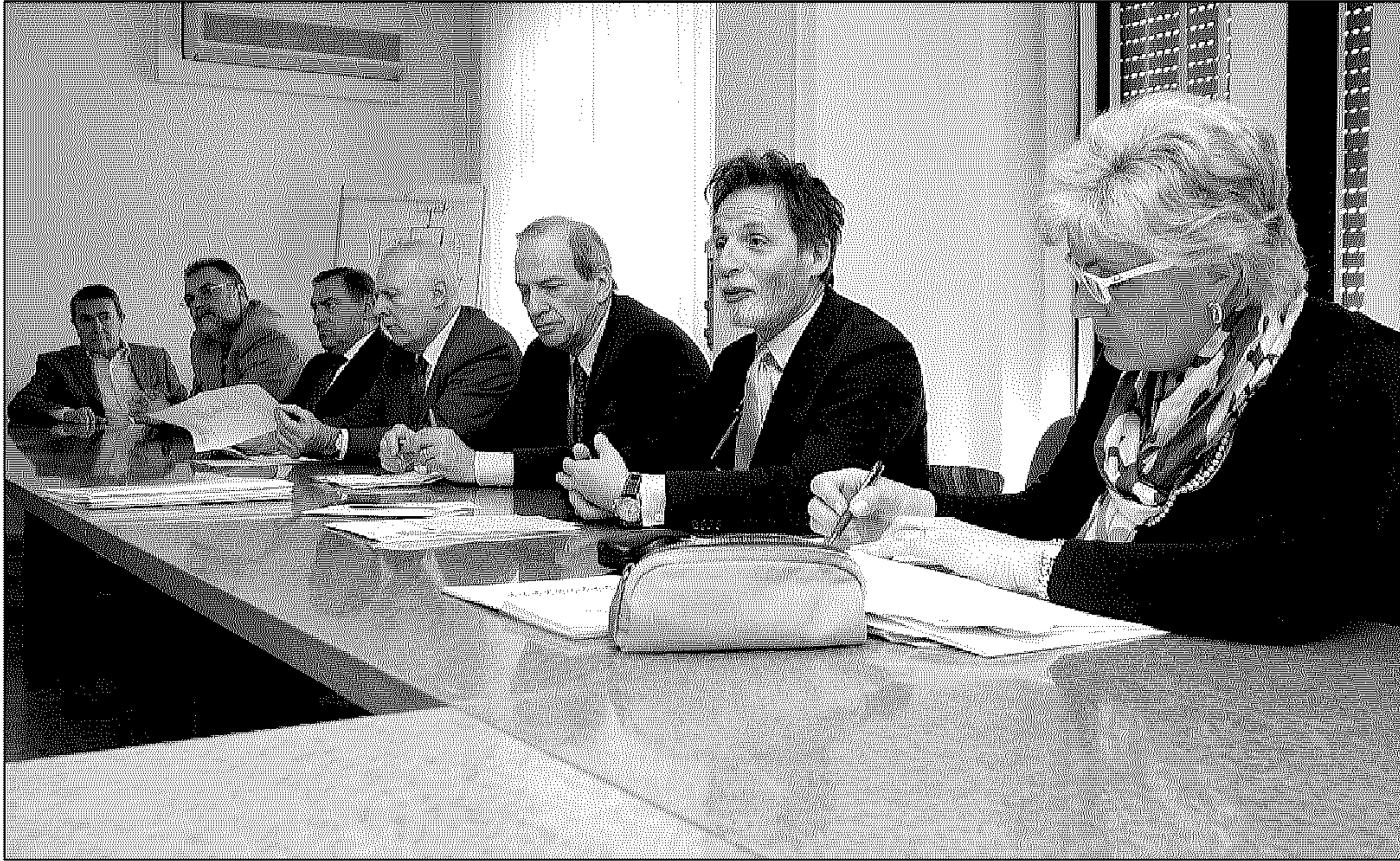
La presentazione, ieri mattina, del finanziamento della Fondazione del Monte di Bologna e Ravenna ai progetti dell'Ausl di Ravenna sul secondo parere e sul sostegno psicologico